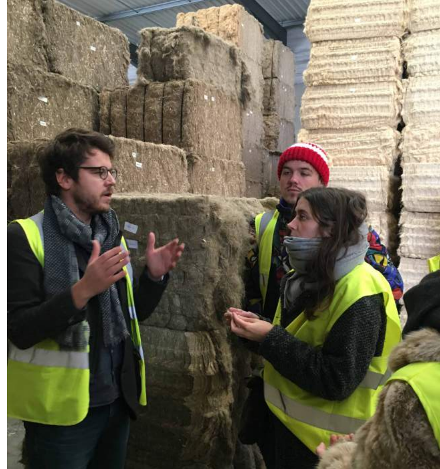
Visite de La Chanvrière Workshop entre école

Partenaires : Laboratoire R&D Fibre Recherche et Développement - FRD, la coopérative agricole La Chanvrière, Interchanvre, et les entreprises Emanuel Lang et la Corderie Meyer-Sansboeuf.