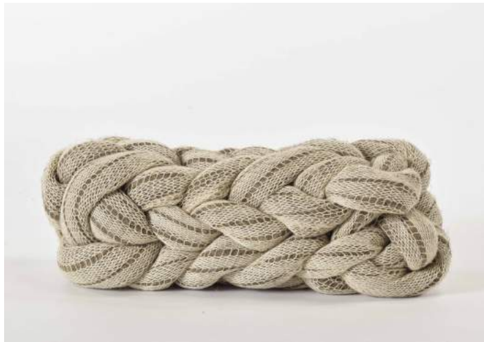
KNIT THE KNIT