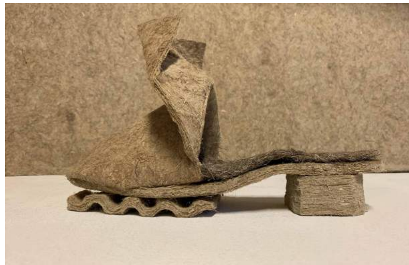
PRESSED HEMP WOOL